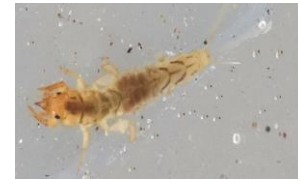
フタスジモンカゲロウ