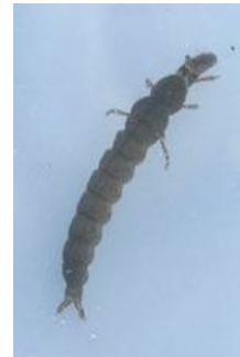
ヒゲナガカワトビケラ