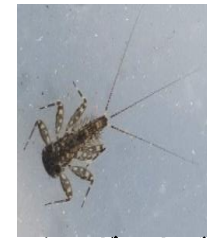
シロタニガワカゲロ