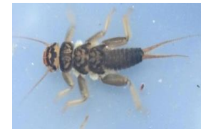
カミムラカワゲラ