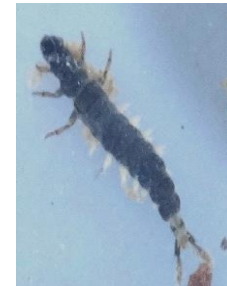
ウルマーシマトビケ