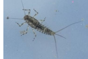
シロハラコカゲロウ