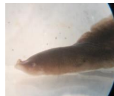
アメリカツノウズムシ